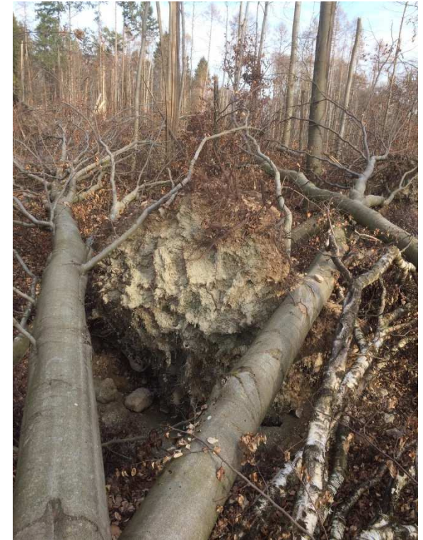
Windwurffläche nach Sturm Fabienne, Forstbetrieb Ebrach, Revier Winkelhof, Abteilung Wildenberg