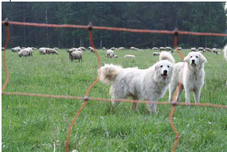
Abb5: Wölfe dürfen nicht lernen, dass Weidetiere eine mögliche Beute sind. Daher ist Herdenschutz ohne praktische Alternative. Er ist notwendig, egal ob es in einem Gebiet zehn oder 100 Wölfe gibt. Ebenso notwendig ist die selektive Entnahme von Einzelwölfen oder Rudeln, die Weidetiere trotz Herdenschutz bejagen. Im Interesse der Koexistenz gibt es dazu keine Alternative.

Andreas Schenk Referent für Verbandskommunikation beim Bundesverband Berufsschäfer e.V., Bochum andreas.schenk@berufsschaefer.de