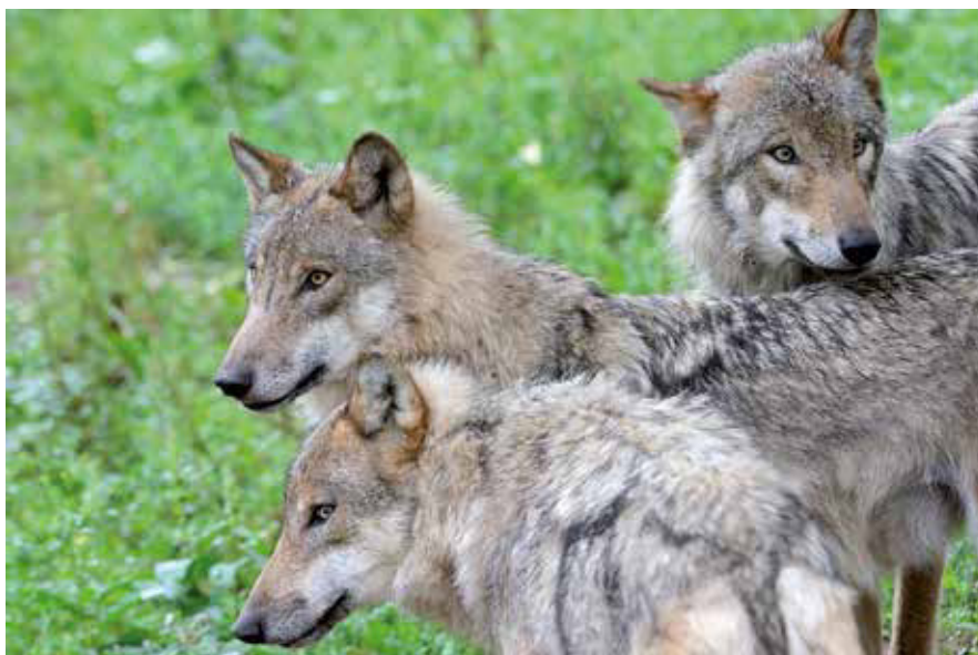
Es ist wissenschaftlich unbelegt, dass freie Bejagung von Wölfen zu weniger Übergriffen auf Nutztiere führt. Es gibt sogar Hinweise, dass Übergriffe nach Abschüssen zunehmen können. Mögliche Erklärungen dafür sind Störungen der Rudelstrukturen und das Nachrücken von Jungtieren ohne Scheu vor Herdenschutz in freigewordene Territorien.

Im Konzept der Bestandsobergrenze werden Tierbestände, die eine definierte Grundpopulation übersteigen, zum Abschuss freigegeben. Im Fall des Wolfes