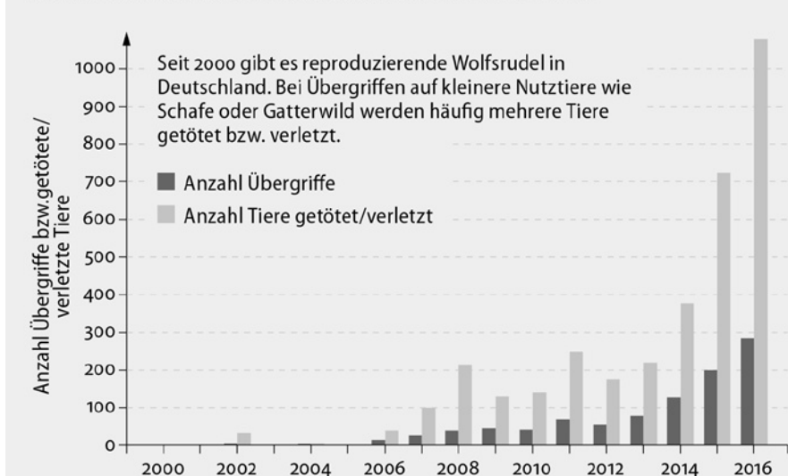
Abb. 1: Wolfsverursachte Nutztierschäden in Deutschland